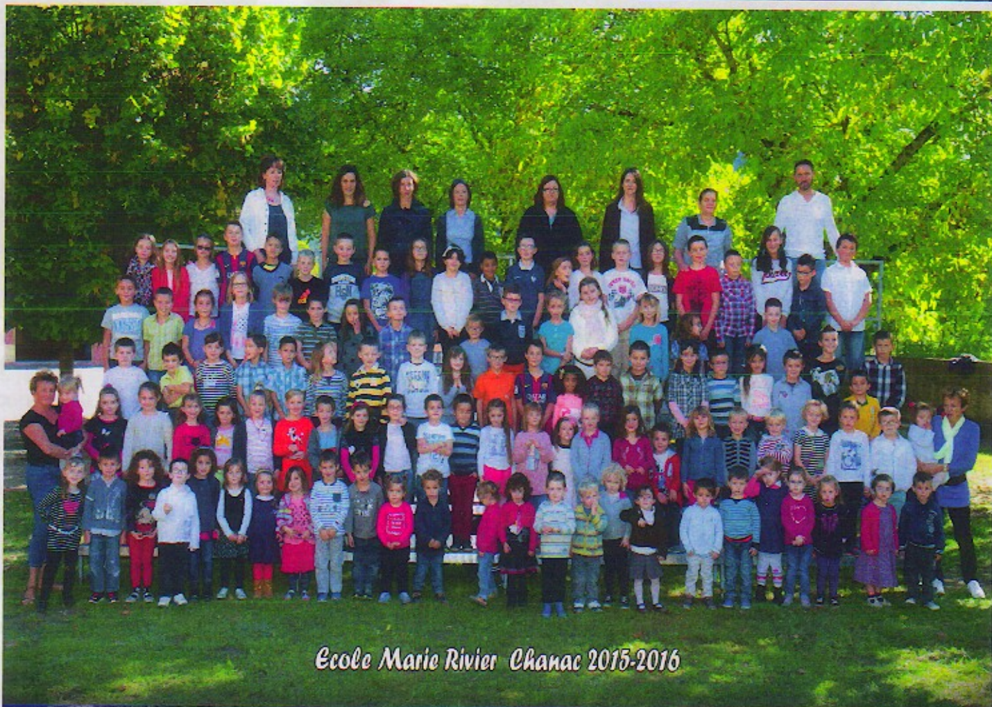
École Marie Rivier Chanac 2015-2016